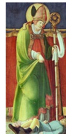
St. Valentin Schutzpatron der Epilepsie-Kranken